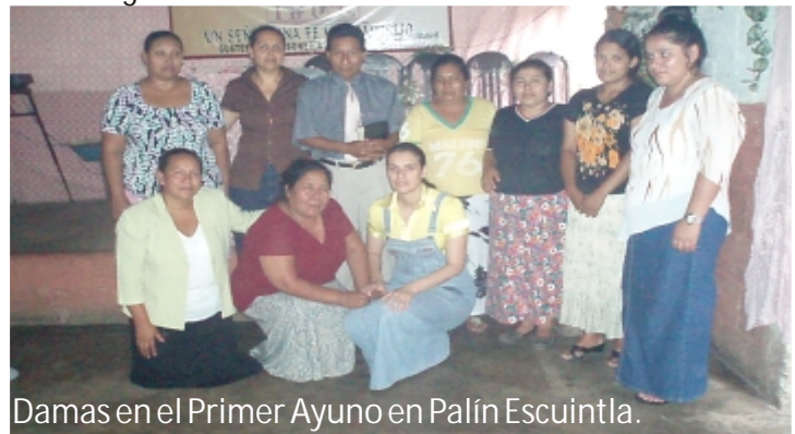
Damas en el Primer Ayuno en Palín Escuintla.