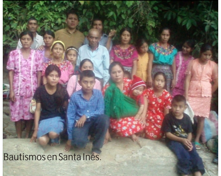
Bautismos en Santa Inés.

abrió el entendimiento y con mucho gozo recibieron su palabra, 19 de ellos tomaron la decisión de ser bautizados en el nombre del señor Jesucristo.