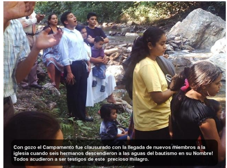
Con gozo el Campamento fue clausurado con la llegada de nuevos miembros a la iglesia cuando seis hermanos descendieron a las aguas del bautismo en su Nombre! Todos acudieron a ser testigos de este precioso milagro.