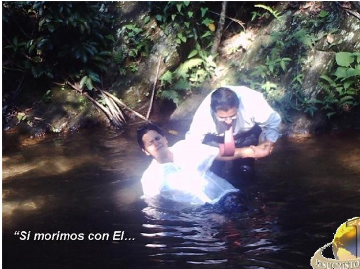
"Si morimos con El..."