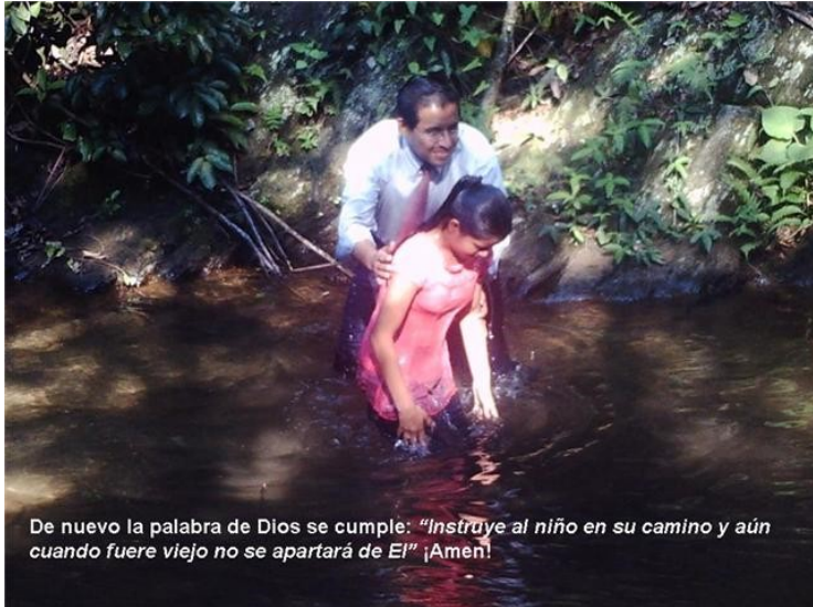
De nuevo la palabra de Dios se cumple: "Instruye al niño en su camino y aún cuando fuere viejo no se apartará de El" ¡Amen!